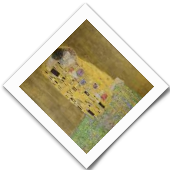
Il bacio di Gustave Klimt