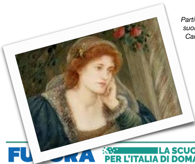
Particolare della statua Ugolino e i suoi figli 1865-67 Jean-Baptiste Carpeaux French

Qualcosa che assomigli all'idea di conoscenza, eleganza, amore.